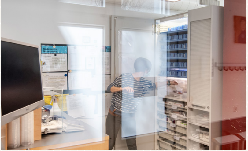
Sichere Medikamentengabe – Vorbereitung nach standardisierten Regeln